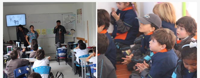
Fotografías de la campaña

Durante todo el mes de mayo se impulsó la campaña “Lavada de manos”, allí se fortaleció en cada salón las instrucciones sobre el correcto lavado de manos, esto con el fin de prevenir enfermedades.