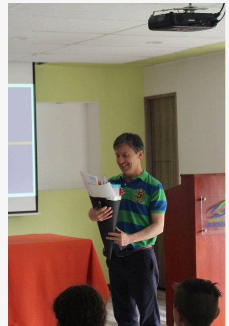
Fotografías Auditorio Irene Steffani