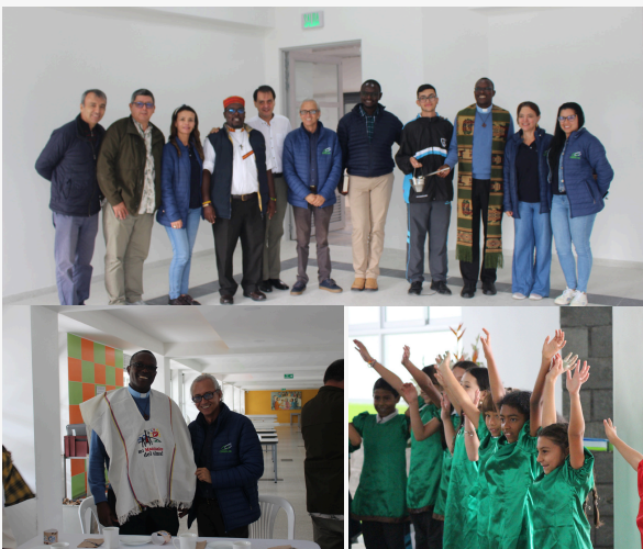
Fotografías de la celebración

La celebración incluyó un emotivo baile realizado por los alumnos del grado tercero, quienes demostraron su talento y entusiasmo. Además, como muestra de agradecimiento y cariño, se les entregaron a los padres unos hermosos ponchos típicos de la ciudad de Manizales, resaltando así nuestras tradiciones y el orgullo por nuestra cultura local.