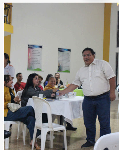
Fotografías Auditorio Principal